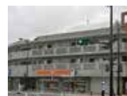
ロータリー2号館住宅