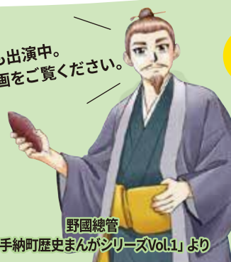
野國總管 「嘉手納町歴史まんがシリーズVol.1」より