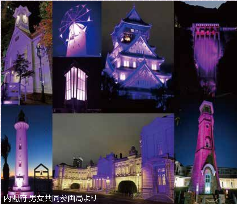
内閣府 男女共同参画局より

「女性に対する暴力をなくす運動」期間にあわせて、女性への暴力根絶のシンボルカラーであるパープルに施設をライトアップするという取り組みです。