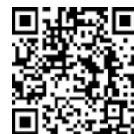
VPDを知って、子どもを守ろう。