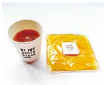
発酵チキンポーンブロス