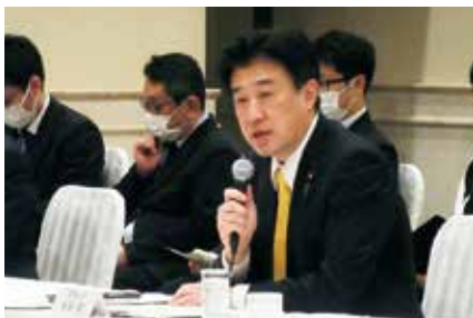
2月17日 木原稔防衛大臣