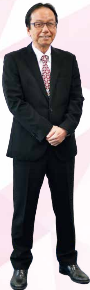
嘉手納町長 當山 宏

また、令和6年度においても、引き続き「活力に満ちたまちづくり」「人に優しいまちづくり」「文化の薫るまちづくり」を目指すとともに「公平公正」「町民本位」「改革刷新」を基本姿勢に嘉手納町のまちづくりを推進してまいります。