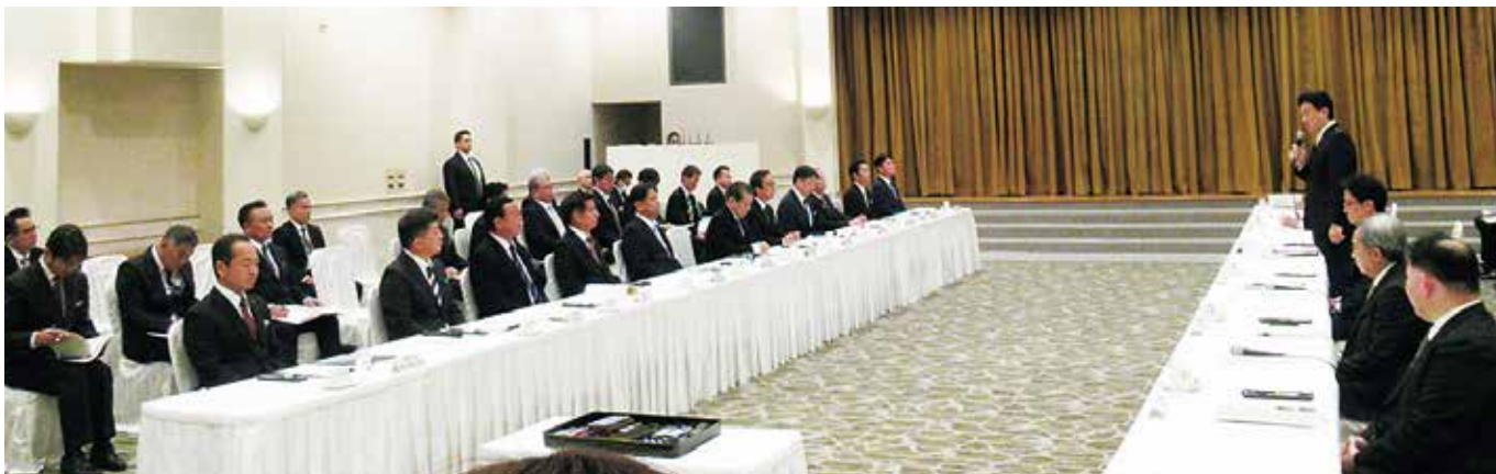
2月17日 県内基地所在11市町村長と木原総防衛大臣との意見交換会