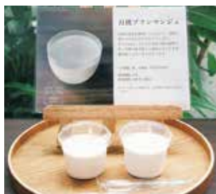
月桃ブランマンジェ