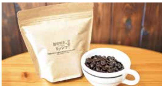
珈琲喫茶カメシマオリジナルブレンド (カメシマブレンド) コーヒー豆