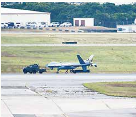
牽引され滑走路を移動する 無人偵察機MQ9

も、依然として町民に深刻な被害を及ぼしております。令和5年度は、所属機の訓練に加えて大規模演習による外来機の大規模飛行が確認された中、F-15戦闘機の退役に伴うF-35戦闘機等の巡回配備が実施されており、90デシベルや100デシベルを上回る耐えがたい騒音被害を町民に与え続けております。同機の運用を行わないことや航空機騒音規制措置の遵守等について、町独自及び三連協として強く要請してきました。