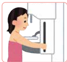
マンモグラフィー