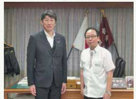
富山町長と岩本剛人防衛大臣政務官