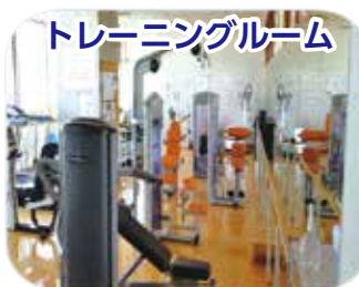
トレーニングルーム

増進センターは6階な ので景色が抜群! たく さん運動して、心も体 もリフレッシュさせま しょう!