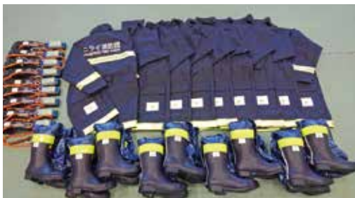
消防団用防火服等一式

ニライ消防団では宝くじの社会貢献広報事業(コミュニティ助成事業)を活用し、防火服等一式(防火服9着、ロング長靴9足、墜落制止用器具9式)及びトランシーバー6台を整備しました。火災や台風等の災害時に有効活用し地域防災活動に役立てていきます。