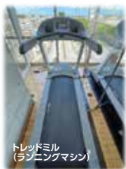
トレーニングルーム・ マシン紹介