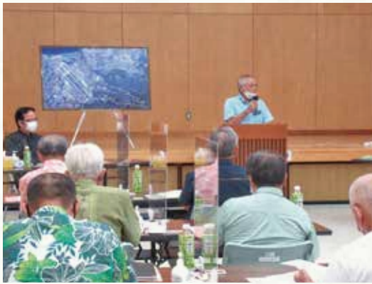
令和4年度嘉手納町基地対策協議会総会を開催 8月5日 北区コミュニティーセンター