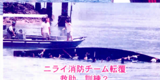
ニライ消防チーム転覆 救助 訓練?

比謝川沿いに陣取った応援団や詰めかけた観客も、参加チームを大きな声援と惜しめない拍手で励まし、選手と一体となって大会を盛り上げました。