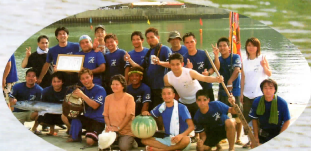
2 連覇 (とび魚チーム)

嘉手納町ホームページアドレス http://www.town.kadena.okinawa.jp