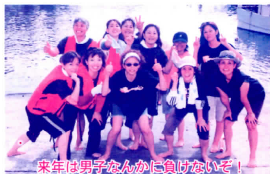
来年は男子なんかに負けないぞ!