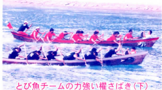
とび魚チームの力強い權さばき(下)