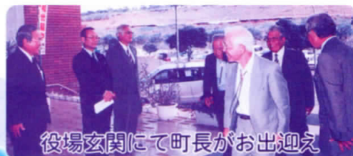
役場玄関にて町長がお出迎え