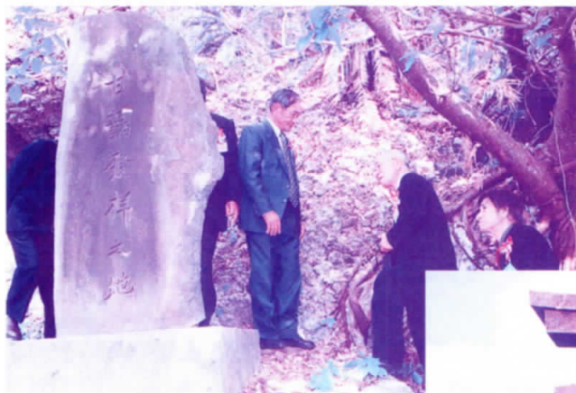
野國總管の墓にて