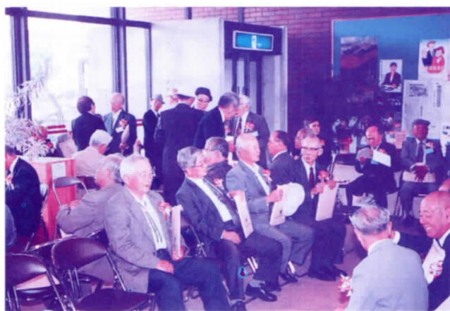
町内視察を前に一休み