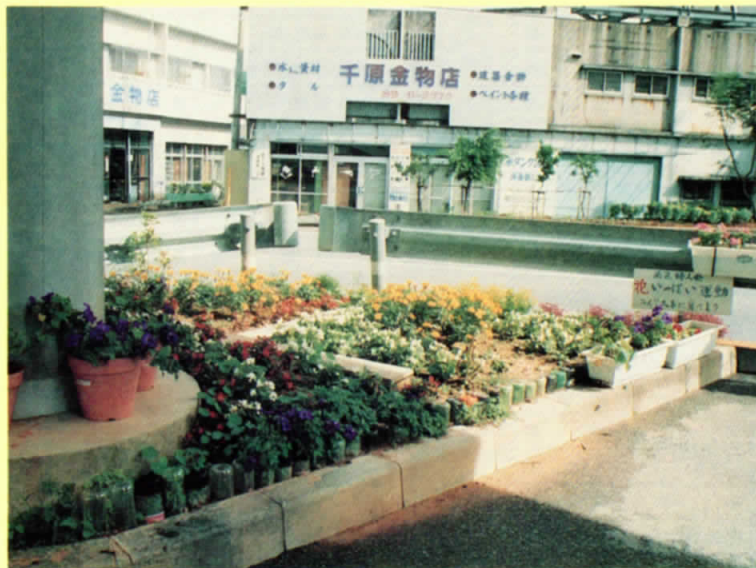
歩道橋の下を有効利用（南区婦人会）