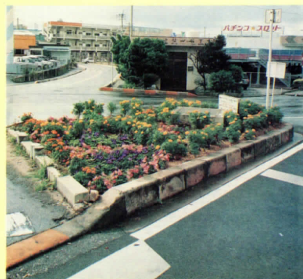
国道58号 付近（西浜区婦人会）

▶世帯数／4,387 ▶男 子／6,945 ▶女 子／7,173 ▶計／14,118名（10月1日現在）