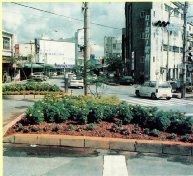
大通交番前（菜の花の会）