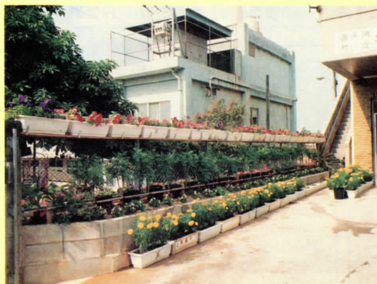
北区公民館 構内（北区婦人会）