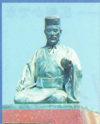
野國總管 生誕の町