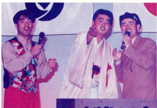
ニーニーズの コントで大爆笑！