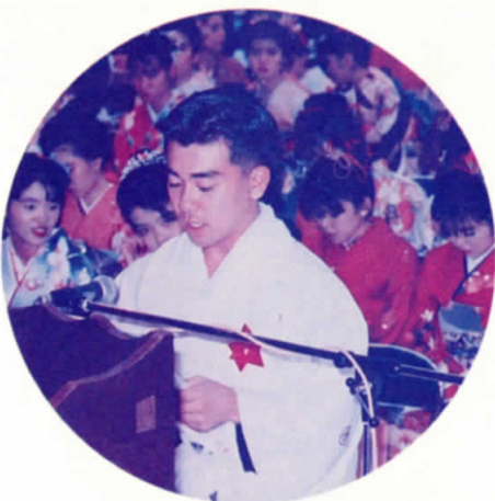
新成人を代表して 答辞を述べる

引き続き、祝賀会が催され、お楽しみ抽選会や今人気のニーニーズのコントなどで盛り上がった。会場は、久し振りに再会する級友や仲間と近況を報告し合うなど、新成人を迎えた若者たちの熱気に包まれていた。