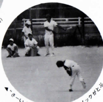
◀ “さーいくぞ”監督のキョウレツなノックがとぶ