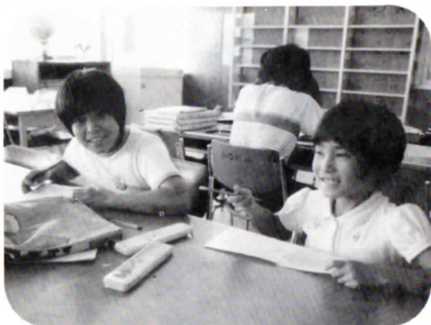
▲図書館は学生でいつも満員（中央公民館）