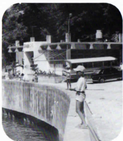
◀ 漁港で魚つりを楽しむ小学生