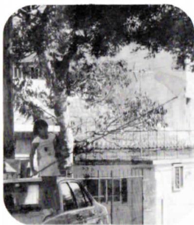
▲こん虫採集も夏休みの宿題の一つ