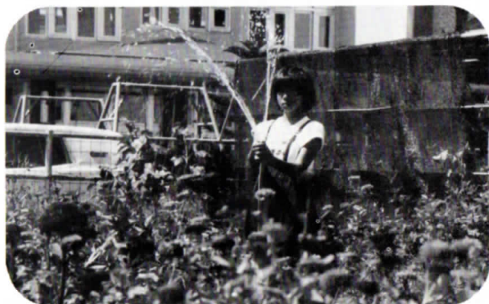
▲夏休み期間中でも花園の手入は欠かせない