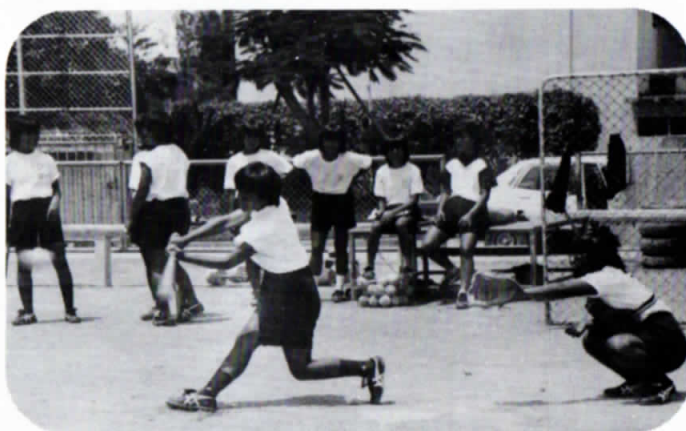
▲ 西日本中学生ソフトボール大会へ向けて特訓中