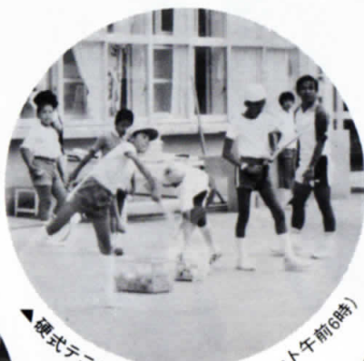
◀ 硬式テニスの早朝練習(嘉中コート午前6時)