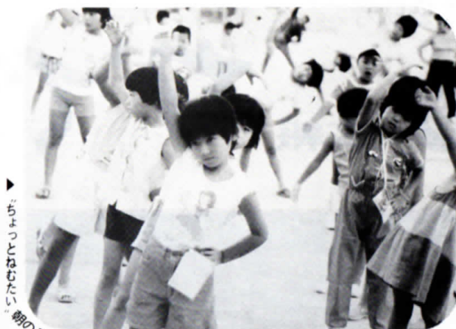
◀ ちよつとねむたい