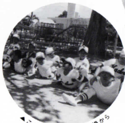
◀ こかげの下でまず柔軟体操から