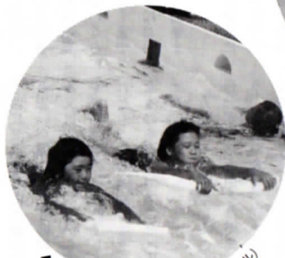
▲すばらしい泳ぎですね（屋小プール）