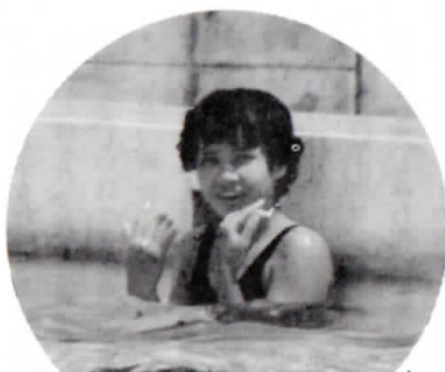
▲泳げずとも、夏の暑い日はこれにかぎる （嘉中プール）