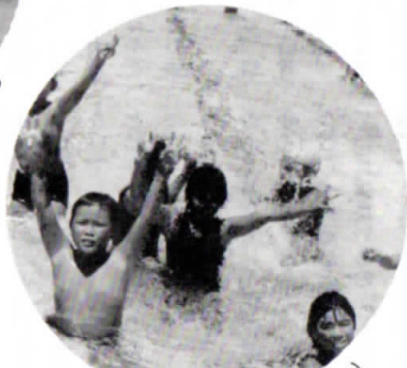
▲プールはいつも満員（嘉小プール）