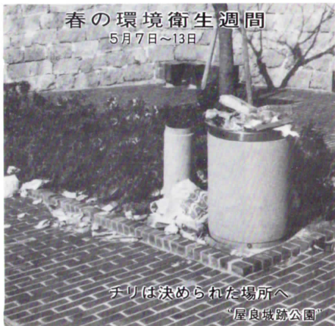
チリは決められた場所へ "屋良城跡公園"