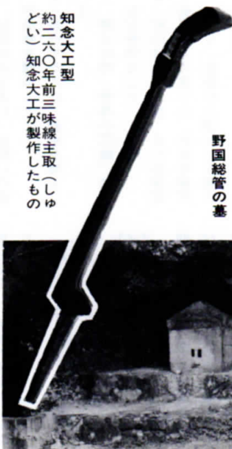
知念大工型 約二六〇年前三味線主取（しゅどい）知念大工が製作したもの

からなっていて、内容は、目的、用語の定義、審議会の設置、指定管理、補助金の交付、罰則等のほか、文化財の指定に必要な事項がうたわれております。 また、この条例の主管は嘉手納町教育委員会、文化財の指定は同委員会がしますが、この指定にあつては、嘉手納町文化財調査審議会の意見を聴いて指定するようになっています。