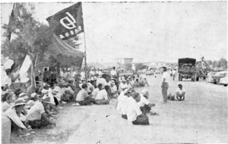
(「砂じん」に抗議して座り込んだ村民)

航空隊内の兼久原に設置 された米軍のアスファルト 工場から南風にのってふき つける砂塵で、村民の生活 はおよそ一カ月にわたって 阻害された。そのため「こ れ以上一日も辛抱すること が出来ない」という村民の 声は次第に米軍当局に対す る不満と怒りの声となって あらわれ始めた。このこと を重視した開会中の村議会 でも、日程を変更して六月 二十日早速抗議決議を行な うとともに全議員が米軍当 局に直訴し、琉球政府や民 政府、立法院などに対して 善処方を要請するなど「白 粉事件」は村ぐるみ斗争 というかつてない事態に発 展した。 以下おおよそ五〇時間にお よび砂じん騒動を追って ました。 最初に村民が砂じんによる