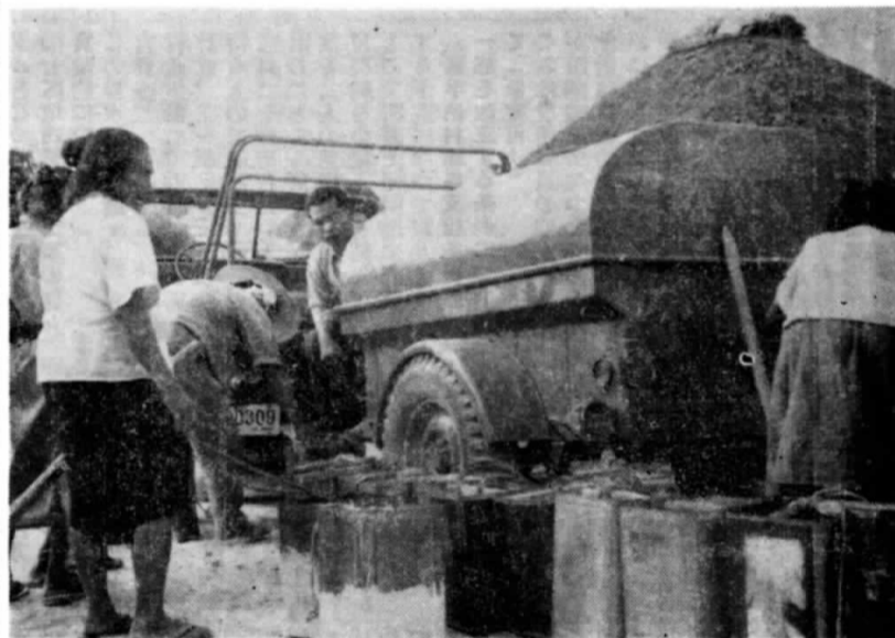
※ 異例の水配給 ※ 半年以上も続いた去年の異常旱魃で1区の2.3.4.5班ではすっかり井戸水が枯れ、村建設課では去る11月2日から28日までの間に同地域住民に23,600ガロンの水を配給しました。(写真は長い列をつくって水の配給を受ける区民)