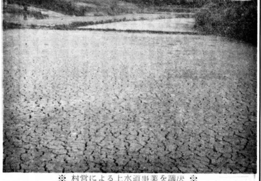
※ 村営による上水道事業を議決 ※ 永年からの懸案である上水道事業を今年3月1日から村営で行なうことを去る9月定例議会で議決になり村当局では今その準備を進めており衛生的な水が皆様の家庭に給水されるのも間近いことでしょう。(写真は去る9月の議会風景)