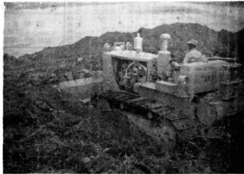
※ 東海電気の奉仕作業で宮前幼稚園敷地々均 ※ 去る11月18日から29日までの11日間、北谷村砂辺在、東海電気の奉仕作業で約300坪の幼稚園敷地がこの程、見事完成し村民から感謝された。(写真は全馬力をかけて敷地々均をする重機)