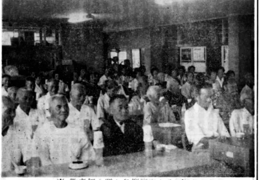
※ 敬老年金贈与条例制定さる ※ 本村では去る6月の臨時議会で敬老年金贈与条例が議決になり、その第1回目の年金交付式を9月15日(としよりの日)に80才以上の該当者116人を村役所会議室に集めて行ないました。(写真は敬老年金を受けてよろこぶお年寄り達)