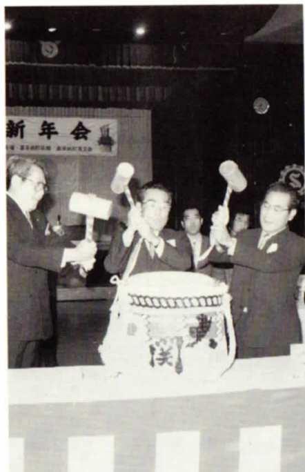
▲町長、議長、商工会長による鏡わり

新春町民のつどいは、終始なごやかな雰囲気につつまれ、新年の門出を祝う語らいの場となりました。