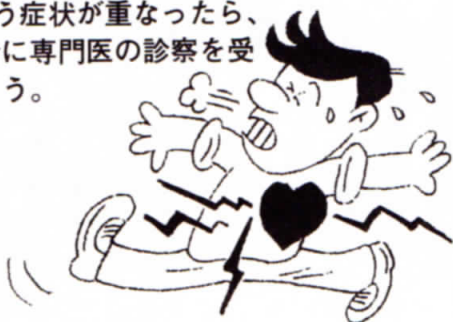
平成元年 検診結果より