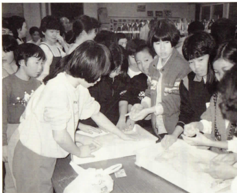
▼大山町の皆さんともち作りを楽しむ