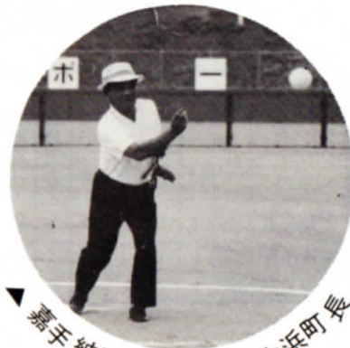
▲ 兼手納野球場始球式吉浜町長