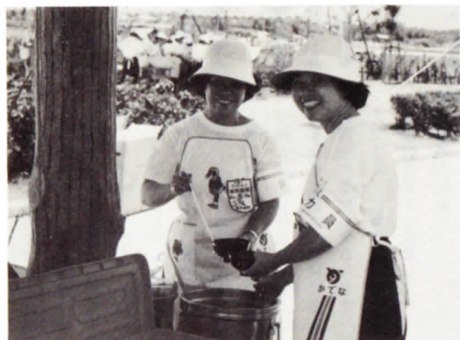
▲ 婦人会の皆さんおいしいみそ汁ありがとうございました