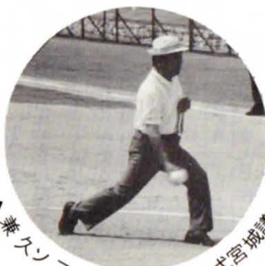
▲ 兼スフトボール場始球式宮城議長