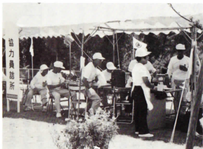
▲ 老人クラブの協力員の皆さん大変ご苦労さまでした