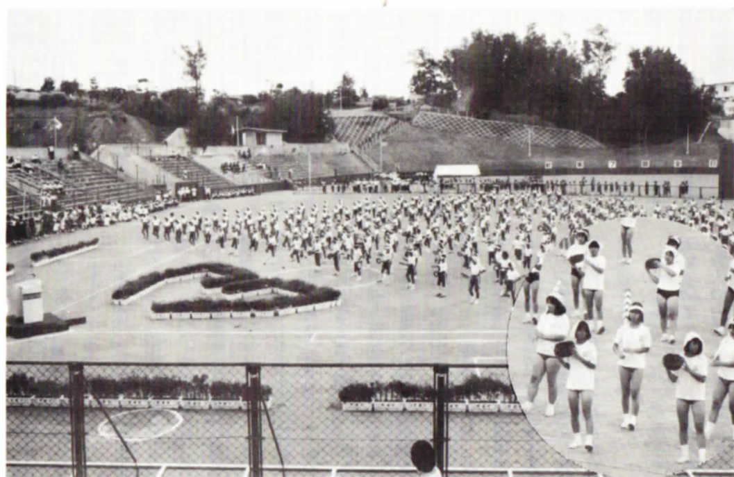
▲ 開会式に先だち小中学生により素晴らしい郷土芸能文化の集団演技が披露された