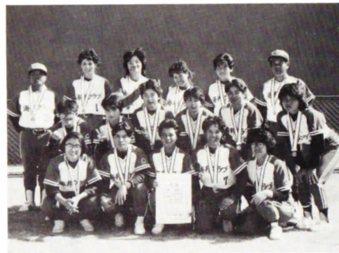
▲ 三位入賞した海邦クラブの皆さんおめでとう

今年の暮れにチームを結成したばかりなので、まさか決勝まで勝ち進むとは思ってもみなかった。準優勝は最高の出来である。沖縄は暑いとは思っていたが、これ程暑いとは思わなかった。でも、準優勝というお土産を持って帰れるので大変うれしい。来年の国体出場を目標にして帰ってからまた頑張ります。